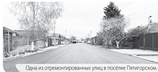
Одна из отремонтированных улиц в посёлке Пятигорском.

В посёлке Пятигорском отремонтировали сразу две основные улицы населённого пункта - Восточную и Родниковскую.