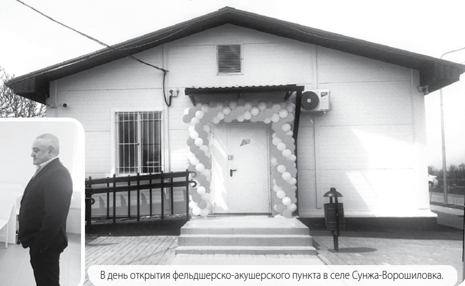
В день открытия фельдшерско-акушерского пункта в селе Сунжа-Ворошиловка.

Соб. инф.